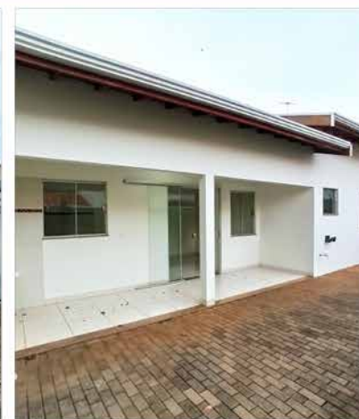
- IMIGRANTES - Cód. 582