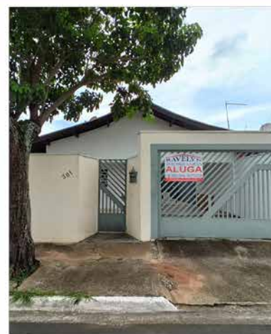
- IPÊ - Cód. 581