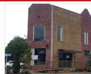
- GIRASSÓIS DE HOLANDA - Cód. 524