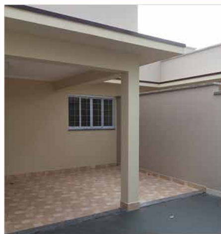
- JD DAS TULIPAS - Cód. 500