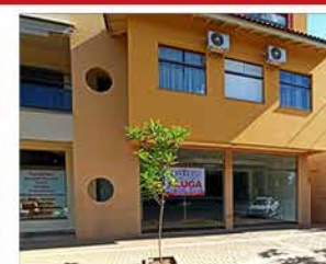
- CENTRO - Cód. 580