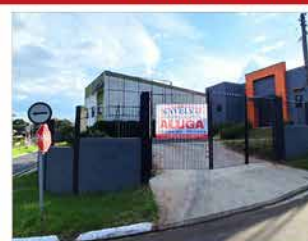
- CENTRO - Cód. 583