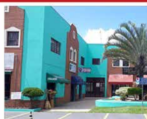
- CENTRO - Cód. 374 / 543