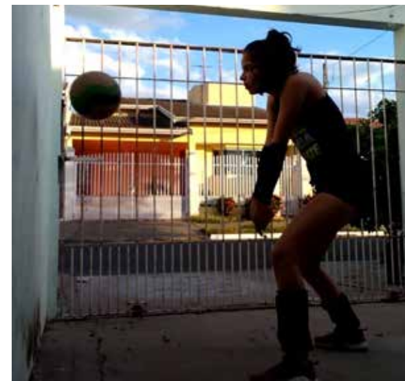
Thuania no Regatas e em casa: treinos não podem ser interrompidos com a pandemia

mo com as dificuldades que vieram com a pandemia, não vou desistir. Me esforçarei em casa, para que quando tudo voltar, eu esteja em forma e ainda mais preparada”.