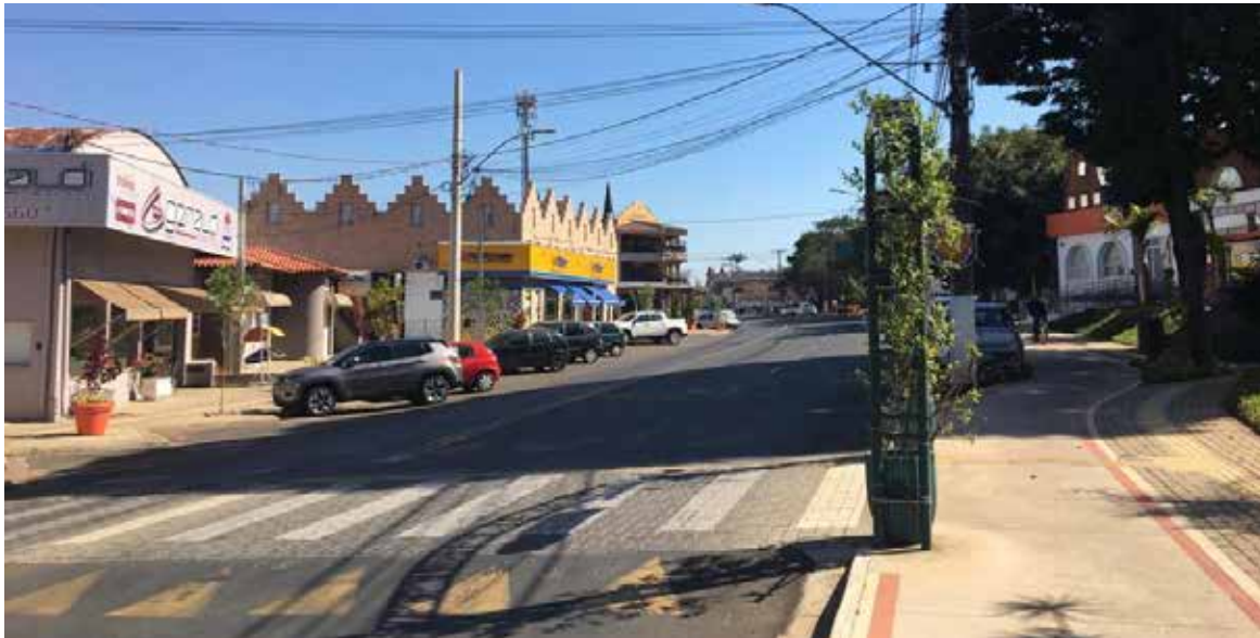
Comércio de bens e serviços pode retomar atendimento presencial, mas deve seguir regras

Cidade tem 23 casos confirmados: dois estão internados; reabertura de comércios seguirá determinação do MP