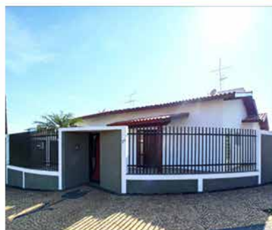
- JD DAS TULIPAS - Cod. 599