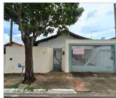
- IPÊ - Cod. 581