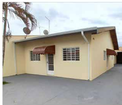
- JD DAS TULIPAS - Cod. 588