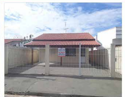
- JD DAS TULIPAS - Cod. 396