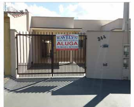
- JD DAS TULIPAS - Cod. 456