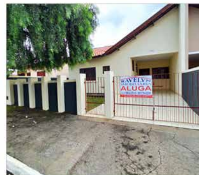
- GROOT - Cod. 578