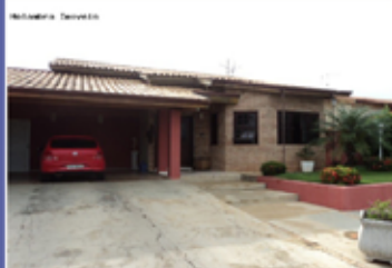
COND. NOVA HOLANDA

Casa para venda, 03 suítes com closet, sala com pé direito alto, cozinha com AE, edícula com dormitório, banheiro, churrasqueira, e quintal com piscina. AC-225m 2 AT-450m 2 (CA00220).