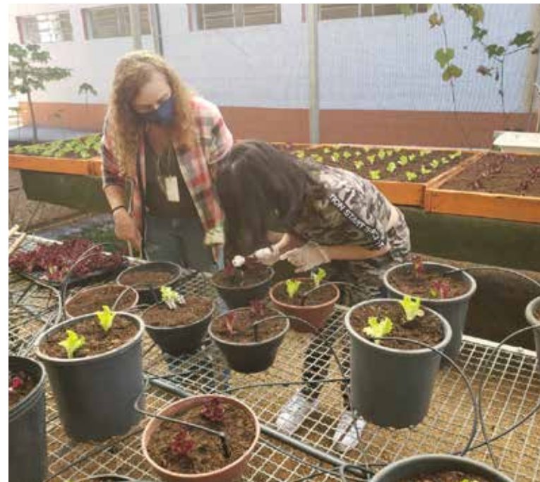
Horta no Naott: educação ambiental está entre os itens avaliados para a conquista do selo de Município Verde Azul

Verde Azul foi lançado em 2007 e avalia a eficiência da gestão ambiental nas cidades paulistas (recebem o selo aquelas que somam a partir de 80 pontos e preenchem requisitos pré-definidos para cada ciclo). O ranking foi divulgado pela primeira vez em 2011, com Holambra na 617ª posição. No ano seguinte, a cidade não pontuou. A partir de 2013, Holambra começou a avançar posições: ficou em 463ª e, em 2014, na 355ª. Recebeu a premiação referente aos anos de 2015, 2016 e 2017 e ficou fora em 2018. Com a reavaliação solicitada em março, voltou a conquistar o selo em 2019.