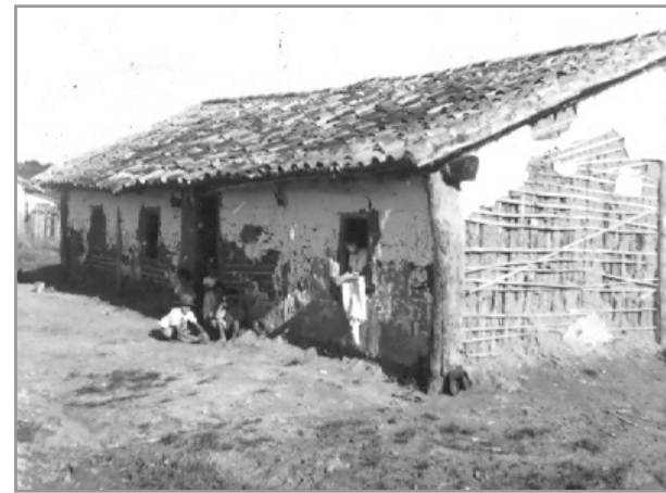
No início: assim como os demais imigrantes, casal Souren em sua casa de pau a pique

que. As casas de alvenaria foram ocupadas pela parte administrativa e as de pau a pique foram disponibili-