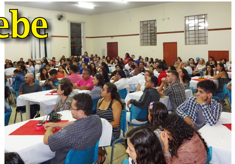
Todos juntos: um dos momentos de integração entre diretoria e colaboradores da APB, pais e jovens acontece no final do ano, com a formatura; reunião inicial, em janeiro, garante primeiro contato entre pais e instituição